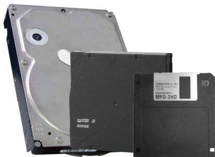
(左から HDD、磁気テープ、フロッピーディスク)