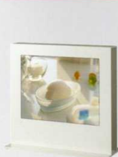
カウンターや受付に ベストマッチ