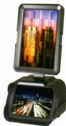
狭いスペース、空いた空間を お洒落に演出するスマートタイプ